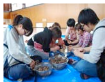
料理教室④とクルミ割り 「しゃべってる暇ないでしょ……ん？」