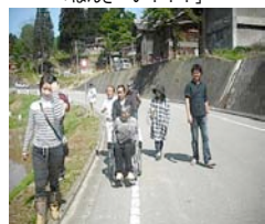
集落内散策。「紫外線きついわ～」