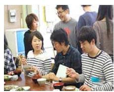
料理教室で作った山菜料理で昼食。 「思ったよりうめ～」