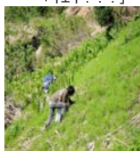
「しゃべってる暇ないでしょ！」

採取した山菜は品目ごとに分け、間に合う分は夕食用に、それ以外は二日目の料理講習に使いました。 更に残った分は持ち帰りとなります。