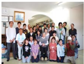
皆さんお疲れ様でした。ありがとうございました。