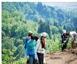
「あの二人、何してんだ？」

今回は5月19・20日に開催された「山菜ふれ愛ツアー」の様をお届けします。 山菜取り参加人数＝36人(ツアー参加者22名、木沢衆12名)。